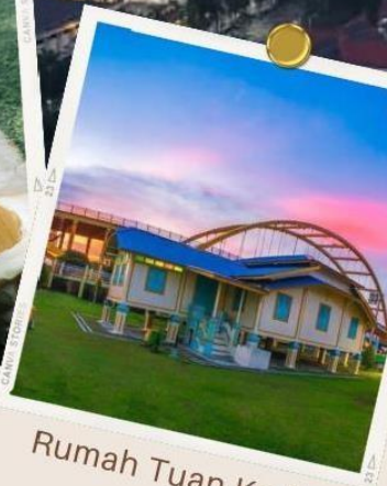
Rumah Tuan Kadi