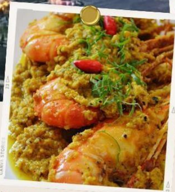
Kuliner Khas Pekanbaru