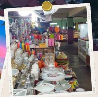
Wisata Belanja Pasar bawah Pekanbaru